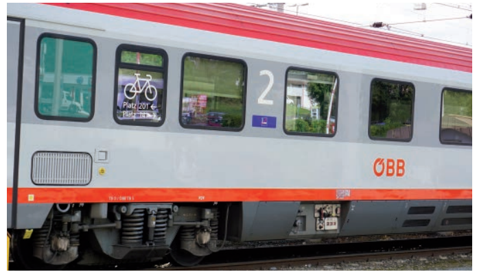
BILD 3 und 4: Glanz auf Fenstern und Lackflächen: Der Schutzfilm auf den ÖBB-Reisezugwagen lässt die Außenhaut „wie neu“ erscheinen

In- und Ausland nachgewiesen. Die funktionellen Novotec-Proteine können aufgrund ihrer hohen Affinität zu Oberflächen den Schmutz gezielt verdrängen und ablösen. Ein zweites Protein bildet danach eine temporäre Schutzschicht mit hydrophilen – also Wasser bindenden – Eigenschaften. Die Schutzschicht legt sich auf die Lackstruktur, füllt kleinste Unebenheiten in der Oberfläche aus und glättet diese somit.